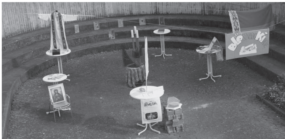
Beim Gemeindeforum am 9. Juli präsentierte sich die Blosenberggemeinde mit Kunstwerken aus der Kirche und Informationen aus dem Gemeindeleben. Auch die syrisch-aramäische und die griechisch-orthodoxe Gemeinde, die regelmäßig in der Blosenbergskirche zu Gast sind, wirkten mit.

Hiermit möchte ich mich als neue Erzieherin im Elly-Heuss-Knapp-Kindergarten vorstellen. Ich heiße Birgit Grau, bin 38 Jahre alt und habe 2 Kinder. Meine bisherige Tätigkeit war im Fröbel-Kindergarten in Eltingen. Seit 12. April 2010 arbeite ich nun an 4 Vormittagen (50%) in der Pinguingruppe. Ich freue mich auf eine gute Zusammenarbeit mit den Eltern und Ihren Kindern.