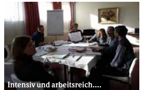
Intensiv und arbeitsreich....

.... aber auch gemütlich und kommunikativ verlief das Kirchengemeinderatswochenende in Zavelstein am 7. und 8. März in Zavelstein